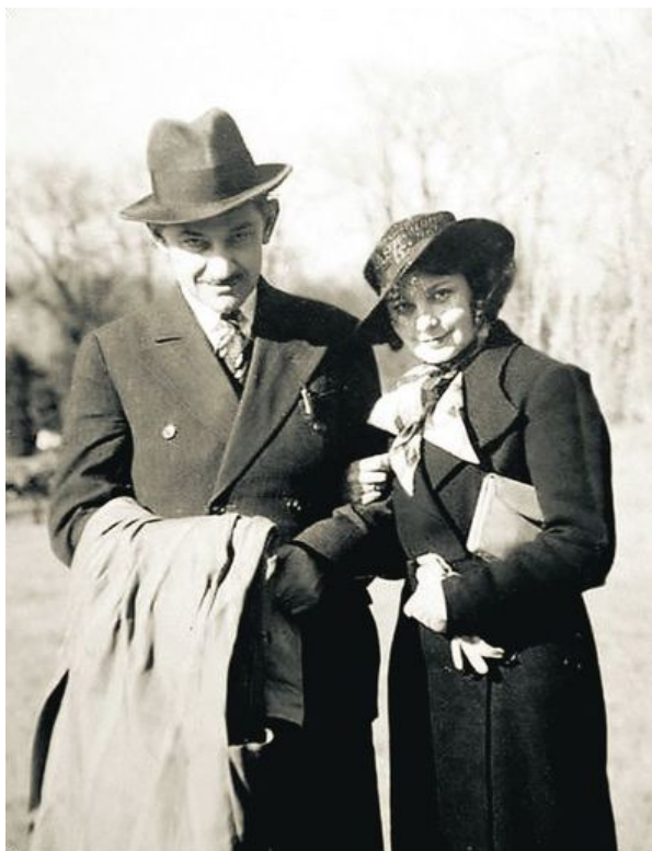
Дмитрий Донцов и Олена Телига