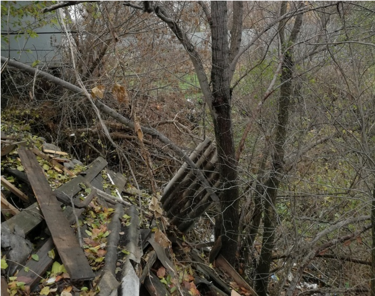
Так выглядит сегодня Покровский яр, где расстреливали евреев

После войны на этом месте проложили улицу, а уже в наше время ров, куда сбрасывали тела убитых, местные стали потихоньку присыпать и строиться прямо на костях. Власть прекрасно знала, что представляет собой эта пропитанная кровью и перемешенная с костями земля, но продолжала выделять участки в частную собственность.