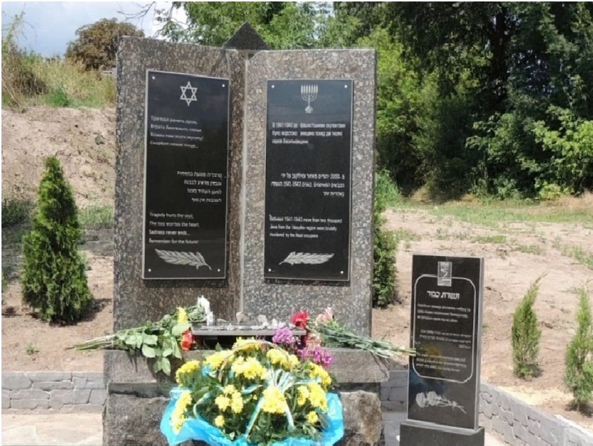
Общий вид памятника

К сожалению, сюрпризы готовили не только «обеспокоенные граждане», но и отдел культуры горисполкома. «А зачем писать, что убитые — евреи?», — удивились там за неделю до открытия мемориала. Это был привет из 1950-х, когда при установке на еврейском кладбище небольшой стелы в память о расстрелянных нацистами соплеменниках, горком запретил перечислять на ней еврейские фамилии, ограничившись традиционным: «Здесь похоронены жертвы фашизма».