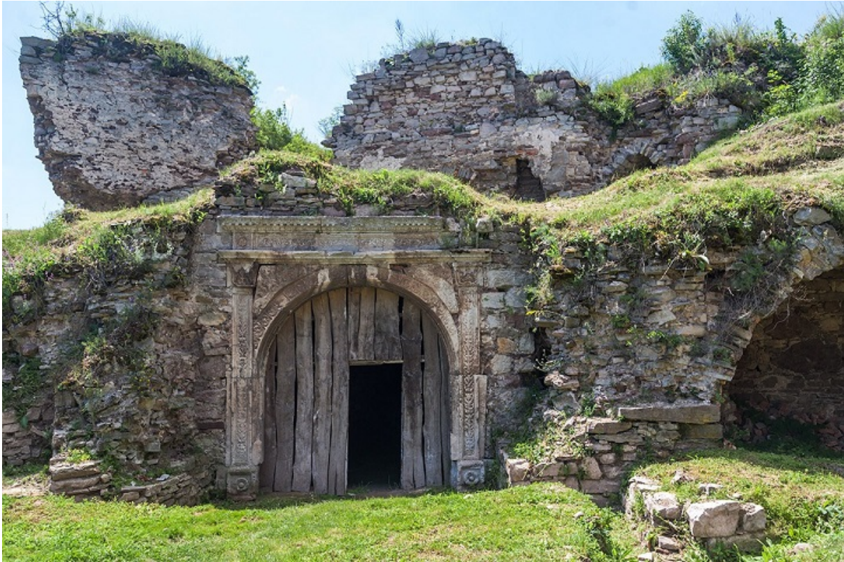
Руины язловецкого замка

Согласно переписи плательщиков подушного налога, по состоянию на 1662 г. в Каменце насчитали 261 еврея, в Язловце — 160, а вот в Сатанове — всего 41-го.