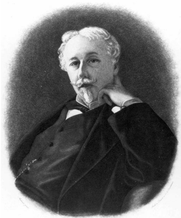
Граф Жозеф Артур де Гобино