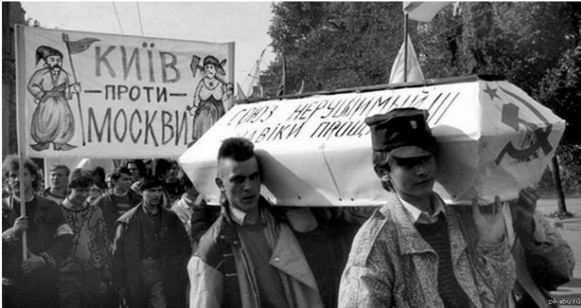
Революция на граните, Киев, 1990

— Никто к этому и не призывает. Но можно ли вступить в Европу с улицами, названными в честь людей, сотрудничавших с нацистами, которые топили в крови остатки этой демократической Европы?