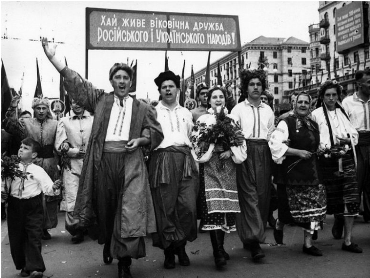
Первомайская демонстрация в Киеве, 1954 год

— Безусловно. Но — в отличие от норвежцев (они вообще арийцы) и финнов — мы в специфической ситуации. Финнов не угоняли на принудительные работы в Германию, не расстреливали заложников и не сжигали финские села. Не уверен, что всем украинцам приятно ходить по улицам имени человека, носившего форму страны, официально считавшей их народ унтерменшами — низшей расой. Это не унижительно для 40-миллионного европейского народа?