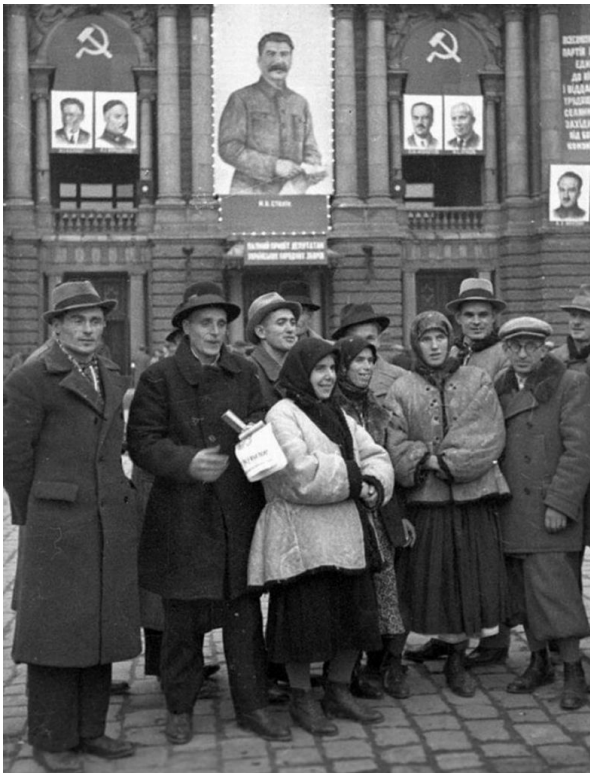
Делегаты Народного Собрания, Львов, 1939