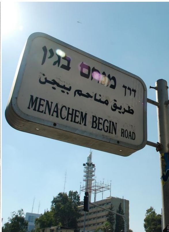
Проспект им. Бегина, Тель-Авив