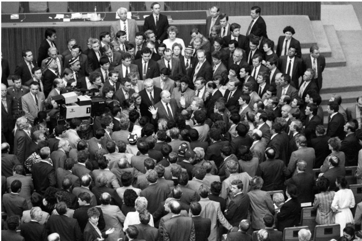
Первый съезд народных депутатов СССР, Москва, 1989

А мне — что скрывать — очень хотелось поучиться в МГУ. Москва тогда считалась центром перемен, и было крайне интересно стать свидетелем и участником этих перемен. Кстати, эпизодом новой эпохи стало создание нами весной 1988-го Общества украинской культуры «Славутич» в Москве и Украинского молодежного клуба — это были первые общественные украинские организации после уничтожения УНР. Мы начали раньше, чем в Киеве, — и я хорошо помню, как активисты, задумывавшие в Киеве Общество украинского языка, обращались к нам за помощью.