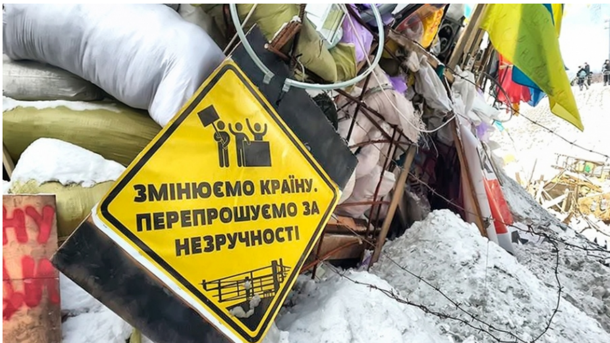
Революция достоинства, 2014

— Есть вероятность того, что будут попытки ревизии политического курса, попытки опять привязать Украину к российской сфере влияния, будут разочарования и кризисы... Рождение украинской политической нации — свершившийся факт, но на кого будет ориентироваться эта нация, — еще вопрос. Мы получили окно возможностей, когда большая часть населения, голосовавшая за пророссийские силы, исключена из электорального процесса благодаря российской оккупации. Но когда территориальная целостность будет восстановлена, то может восстановиться и электоральное равновесие между частью общества, которое хочет в Европу, и той его частью, которая тяготеет к России. Это равновесие всегда было губительным для Украины.