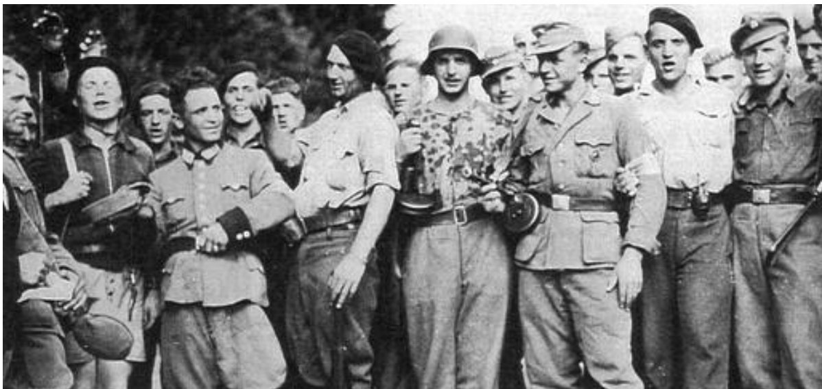
Бывшие шуцманы из 115 и 118 батальонов среди французских партизан, 1944