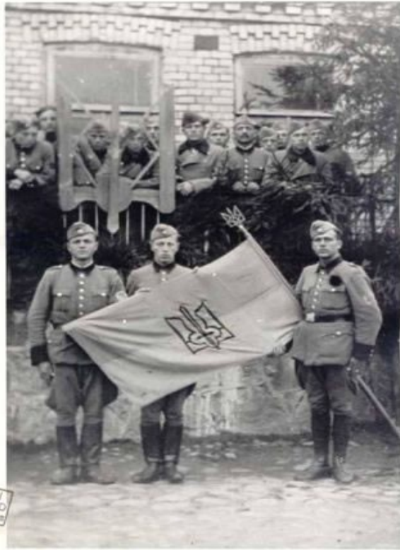
Украинские бойцы шуцманшафта