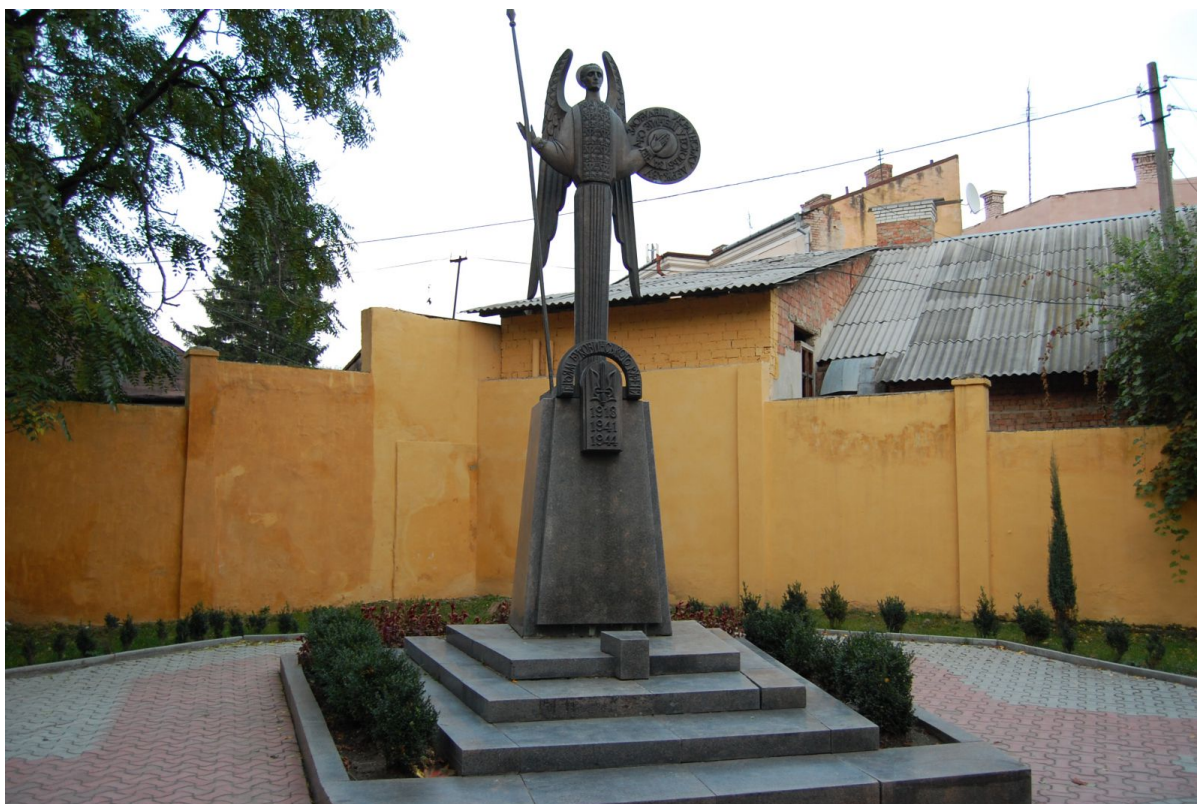
Памятник героям Буковинского куреня, Черновцы