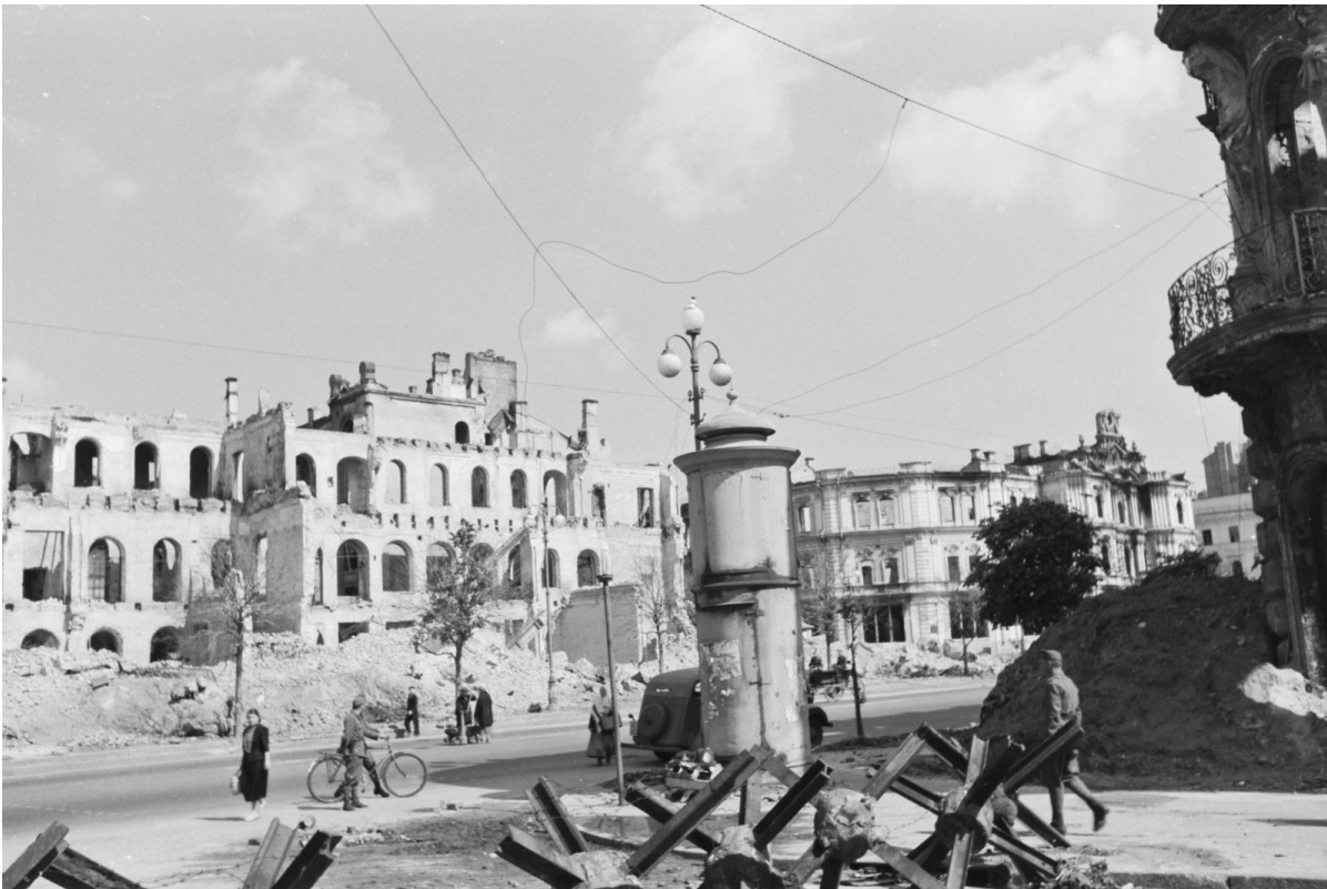
Руины Крещатика, 1942

Но все это затмила дискуссия о не/участии куреня в событиях Бабьего Яра, поскольку это место, действительно, стало символом Холокоста «от пуль» не только в Украине, но и во всем мире.