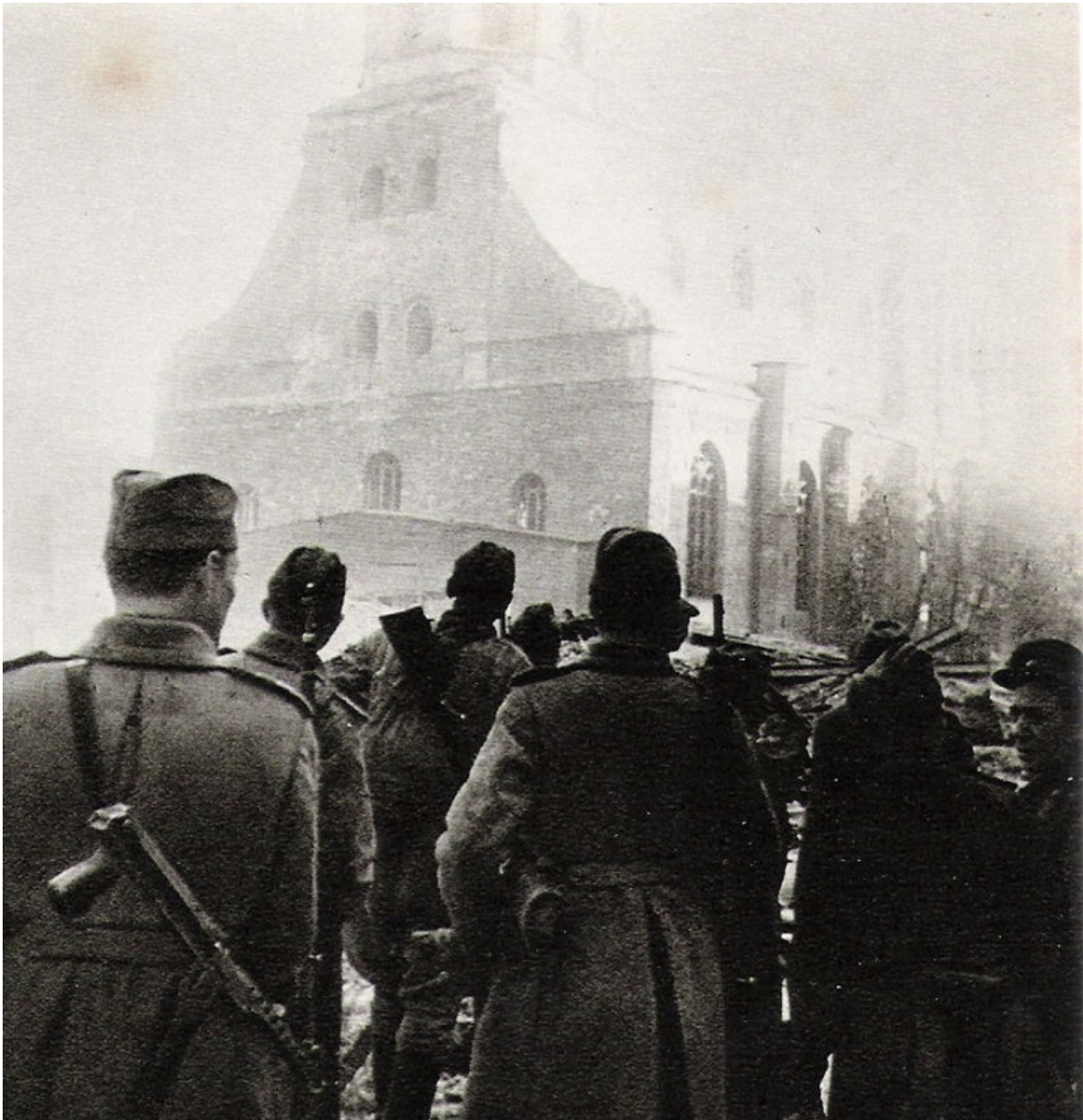
У звільненій Ризі, 1944