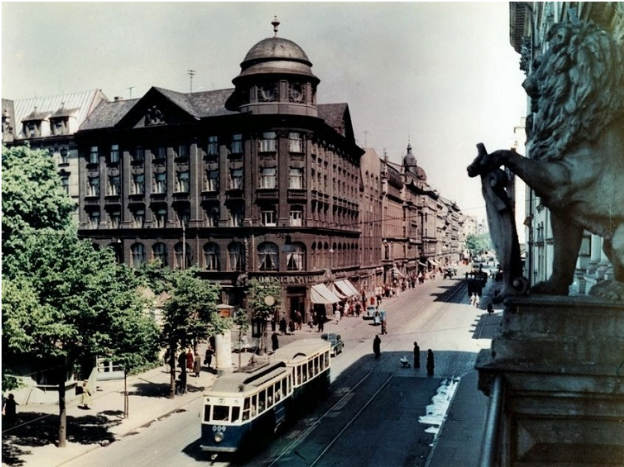
Рига, 1950-ті роки