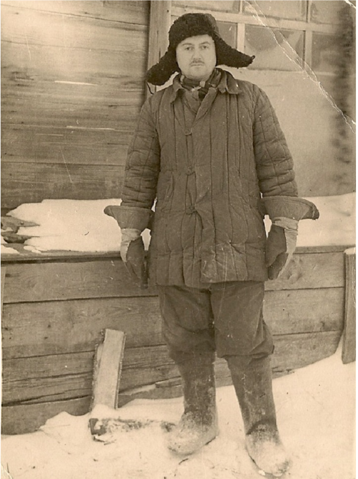
У мордовському таборі, 1960