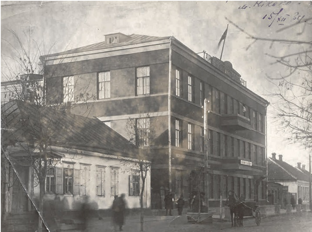
Будівля міськради Нікополя, 1934