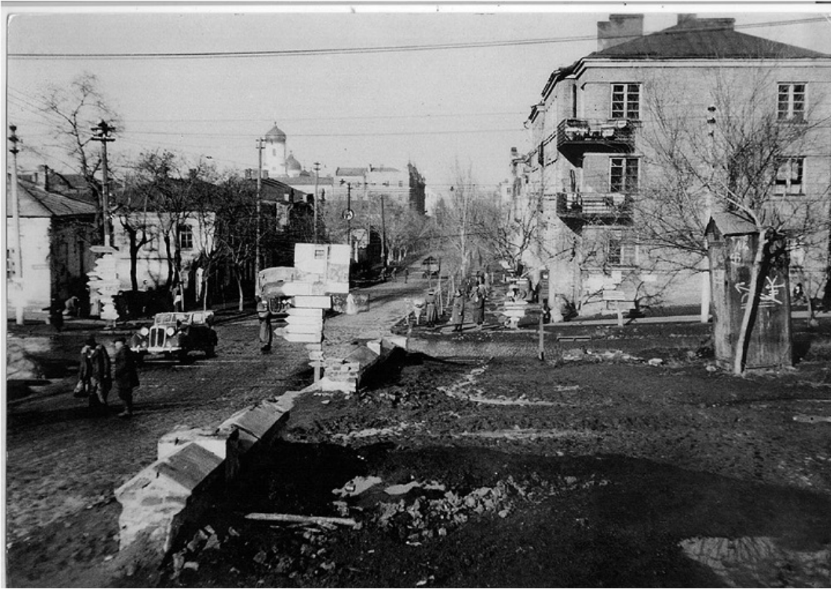
Дніпропетровськ у роки німецької окупації