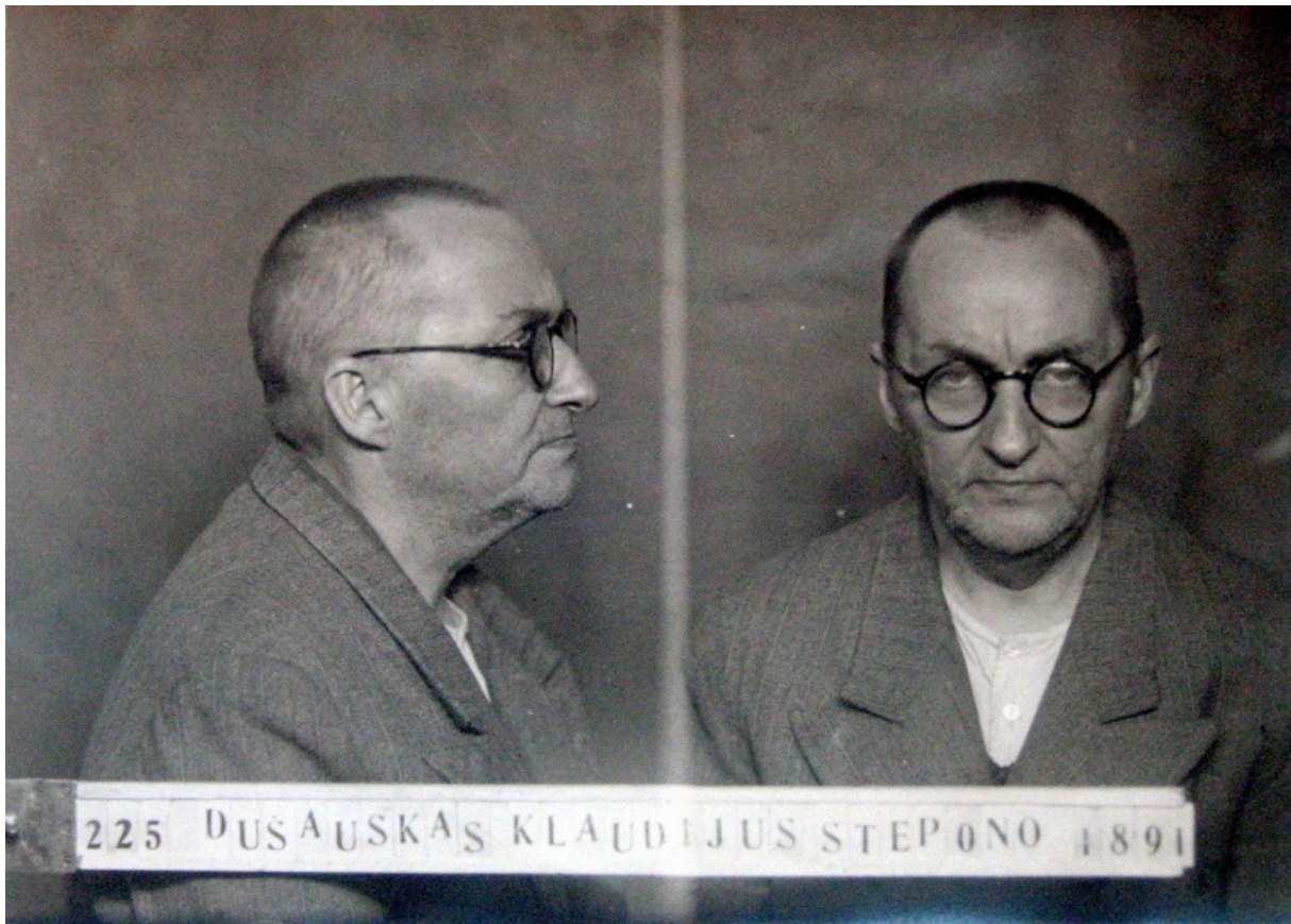
Дуж-Душевский после ареста в 1940-м

Больше годы мировые СМИ полны тревожными сообщениями из Беларуси, где несогласные с результатами президентских выборов граждане выходят на акции протеста с бело-красно-белыми флагами. Запрещенный сегодня официальным Минском флаг стал символом демократических перемен, несмотря на то, что в годы Второй мировой он был присвоен профашистскими коллаборационистами.