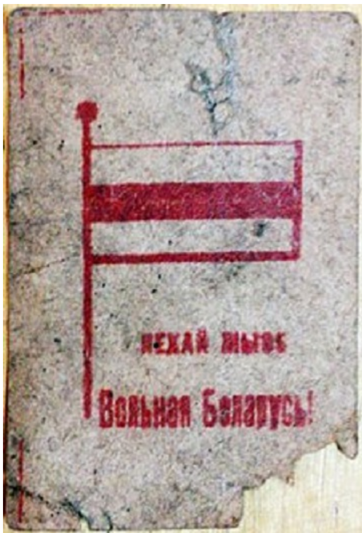
Пропуск на Первый Всебелорусский съезд