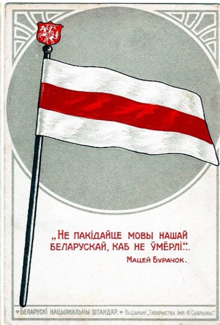
Открытка времён БНР