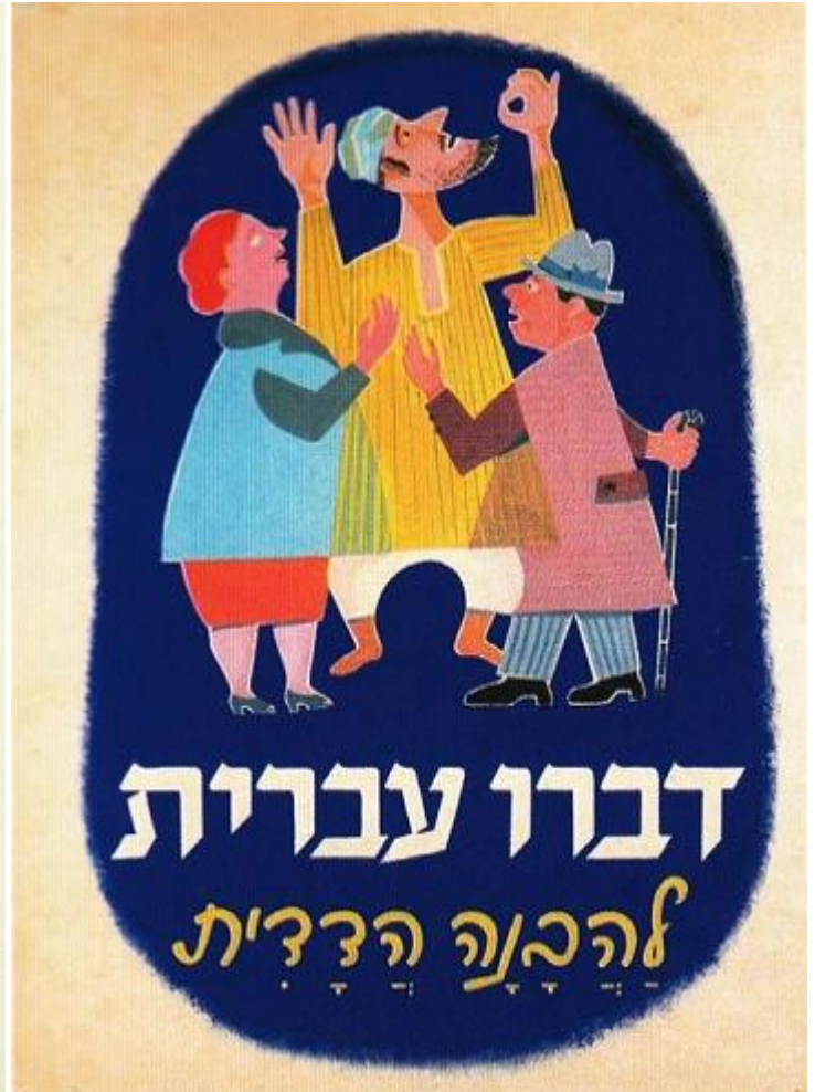
Израильские плакаты, призывающие говорить на иврите

Но объяснить можно и политику Евсекции (создание новой национальности советских евреев). И даже советский государственный антисемитизм (после Холокоста евреи больше не отвечали сталинскому определению национальности, а после образования Израиля и вовсе стали иностранной национальностью, вроде немцев, поляков или корейцев, и их надо было ассимилировать). Можно найти внутреннюю логику в любой политике в истории человечества.