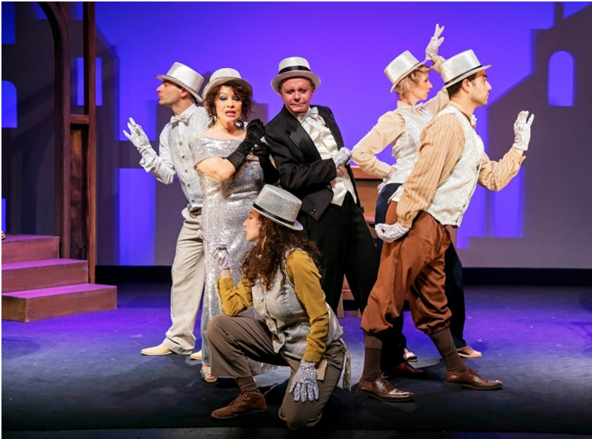
На одном из спектаклей театра «Идишпиль»

В воскресенье, 18-го июля 1948 года редактор коммунистической газеты «Коль ха-Ам» Меир Вильнер явился в военкомат по ул. Калишер в Тель-Авиве для несения воинской службы. На рутинный вопрос, какие языки он знает, Вильнер ответил: иврит, польский, немецкий и идиш. Офицер заявил, что идиш — не язык. Вильнер возмутился, но ему возразили, что издан приказ верховного командования: идиш — не язык. Ивритские газеты отнеслись к инциденту без удивления, мол, идиш — наследие галута (диаспоры), и в новом государстве ему нет места.