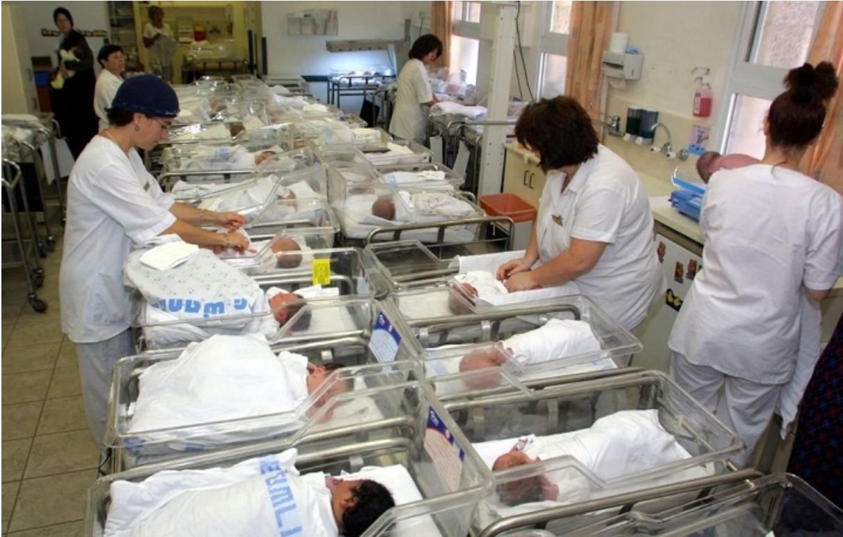
Сучасне пологове відділення «Бікур холім», Єрусалим

Нинішня тенденція чітко вказує на те, що арабське населення є «старіючим суспільством», причому, старіє воно майже в 4 рази швидше, ніж єврейське. І це не дивно, оскільки після арабського демографічного вибуху (1950 — 1964 рр.) арабські бебі-бумери вступають сьогодні в пенсійний вік. Відповідно, це призводить до хвилі природної смертності, значно вищої, ніж пару десятиліть назад.