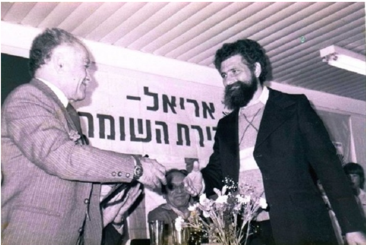
Мер Арієля Яків Файтельсон вітає прем'єр-міністра Ізраїлю Іцхака Шаміра, 1980-ті

— Понад 100 років алія залишалася основним фактором, який перетворив євреїв із незначної меншості в абсолютну більшість в Ерец Ізраель. Навіть незважаючи на те, що арабська народжуваність значно перевищувала єврейську. Водночас ще в 1987-му, представляючи свій перший прогноз прем'єр-міністру Шаміру, я підкреслював, що арабський світ вступає в смугу демографічного переходу (швидке зниження народжуваності і смертності на першому етапі, з подальшим зменшенням народжуваності та зростанням смертності, в результаті чого відтворення населення зводиться до простого заміщення поколінь, — прим. ред.).