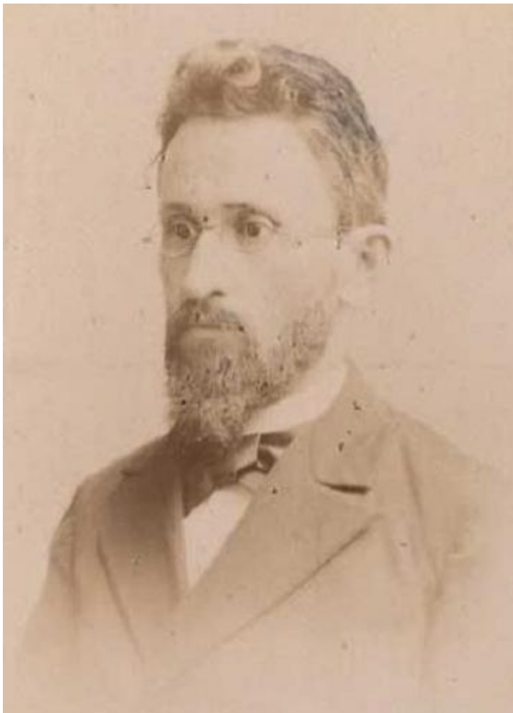
Шимон Дубнов, кінець XIX століття