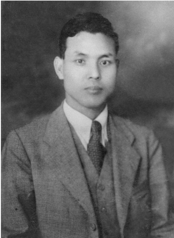
Сабуро Нэи в 1930-е

Китаде. Он знал, что документы, найденные в Москве, указывают на выдачу японских транзитных виз еврейским беженцам, следовавшим через Владивосток. Но ни одной подобной визы не было найдено, пока коллега Китаде из Филадельфии не сообщил ему, что обнаружил документ на японском языке, который не в состоянии прочесть. Как только журналист увидел имя на пожелтевшей бумаге, то понял, что это одна из виз, выданная Сабуро Нэи.