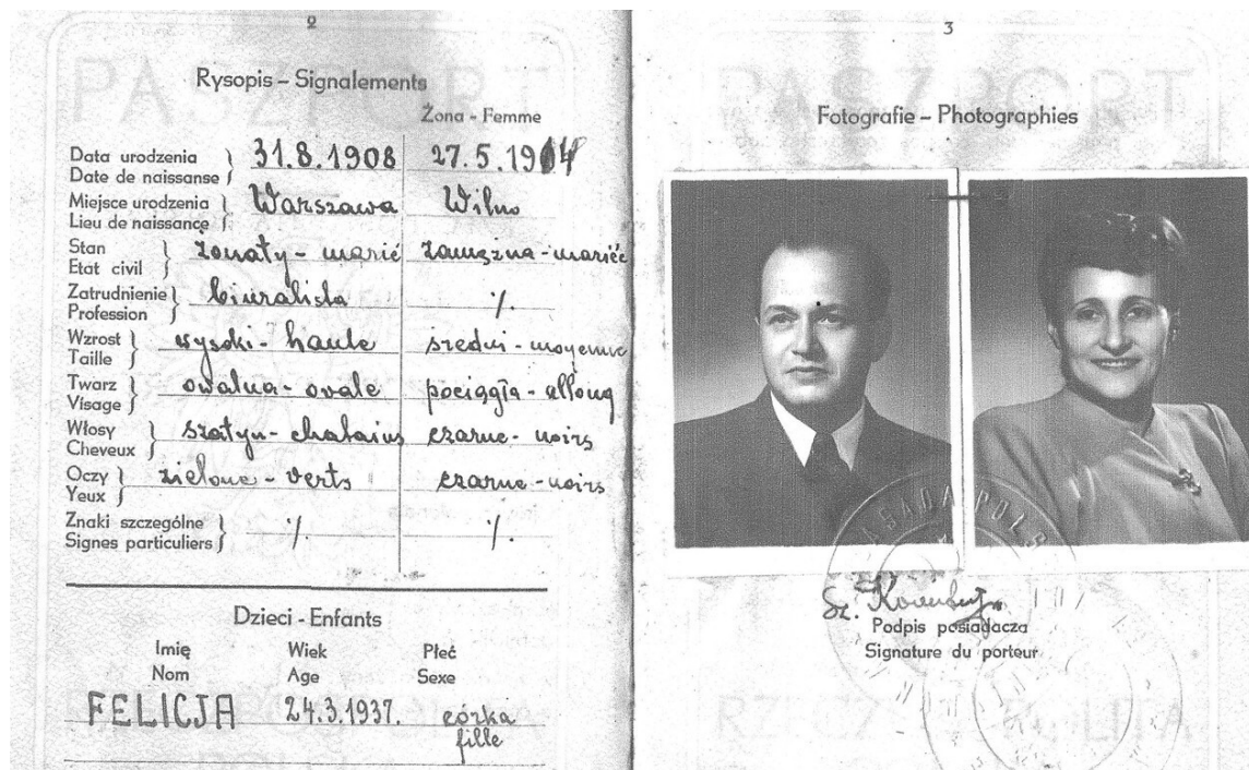
Паспорт Корентахера для получения визы

«Виза числится под номером 21, поэтому можно предположить, что до Корентахера 20 просителей получили аналогичные разрешения, — говорит Китаде. — Но, вероятно, останется загадкой, сколько всего людей спас консул».