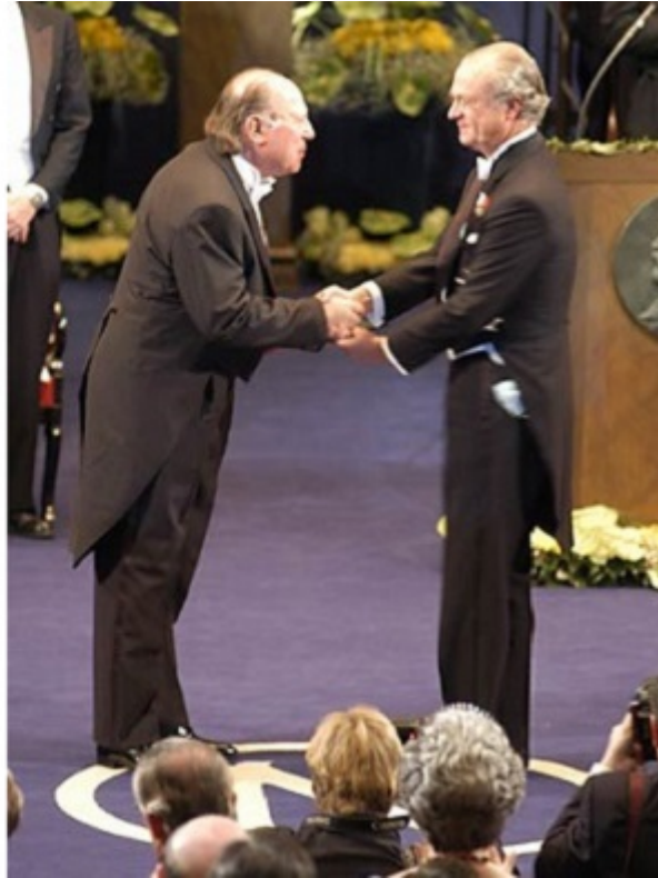
...и на вручении Нобелевской премии

Когда правительство Венгрии под началом Виктора Орбана опубликовало проект школьного плана по литературе, соотечественники с удивлением обнаружили, что творчество Имре Кертеса, первым из венгров удостоенного Нобелевской премии по литературе, больше не входит в список «обязательного» чтения.